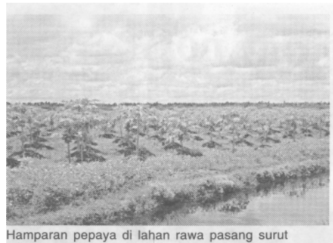
Hamparan pepaya di lahan rawa pasang surut

B erbekal dari keyakinan tim penelitiannya, pepaya ini dicoba diadaptasikan di lahan rawa pasang surut eks PLG Desa Lamunti Kecamatan Mantangai Kabupaten Kapuas Kalimantan Tengah. Benih dibawa dari Balitbu Tropika Solok dalam bentuk kecambah yang dikemas dalam koran lembab dan dibungkus dengan plastik. Setelah dua hari dalam perjalanan, benih ini ditanam dalam polybag dengan media campuran tanah dan pupuk kandang, perbandingannya 3:1 serta ditambah kapur dolomit 50 g untuk setiap media tumbuh berbobot 2 kg.