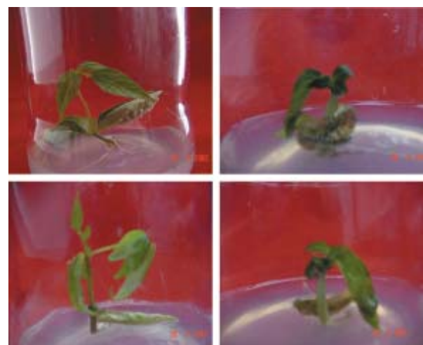
Gambar 1. Keragaman tunas in vitro hasil persilangan antara kacang hijau dengan kacang hitam no aksesori VR-35.

Tunas-tunas yang tumbuh memperlihatkan keragaman yang tinggi (Gambar 1). Tunas tersebut kemudian disubkultur pada media MS atau B5 untuk diperbanyak secara klonal. Namun, tunas-tunas ini tidak dapat mengganda, baik tunas adventif maupun aksilar. Umumnya tunas menunjukkan gejala pembentukan kalus pada pangkal tunas, daunnya gugur dan layu serta akar tidak terbentuk dengan baik. Pelayuan dan gugurnya daun menyebabkan subkultur tunas harus dilakukan dengan cepat, dalam waktu 2 minggu setelah tanam daun mulai layu dan akhirnya gugur. Pelayuan ini juga terjadi pada tunas-tunas pucuk yang disubkultur. Untuk mengurangi daun yang gugur dan layu, dicoba ditambahkan arginin dan glutamin maupun AgNO 3 konsentrasi rendah, namun pertumbuhan tunas justru terhambat dan akhirnya